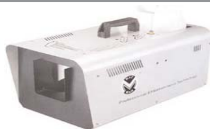
Snow 12: Sneeuwmachine 1200 watt dmx + remote