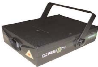
GREEN 30: 30mW groene laser, DMX gestuurd

30mW groene laser met veel voorgeprogrammeerde animaties (geometrische vormen, tunnel effecten, 3D vormen,...) wordt gestuurd via 8-kanaals DMX, master/slave of op muziek, 230V/50Hz - 40W verbruik