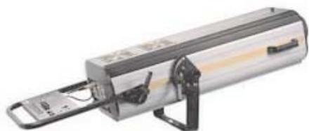
Follow 1200: Mac follow 1200

1200 W HMI follow spot with 4 DMX channels, 7 dichroic color filters, rainbow effect with variable speed, dimmer and strobe. Removable control panel. Optional HMI1200W/GS lamp available. Dimensions: 41.5" x 18.1" x 12.6" (1055 x 460 x 320 mm). Weight: 88.2 lbs (40 kg)