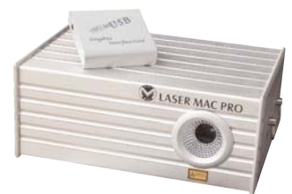
Mac-600: 600mW groene laser met software en interface

200mW groene laser (532nm) in een rigide aluminium behuizing. Beschikt over 10 DMX kanalen maar kan ook in automatische modus werken of via meegeleverde software en USB-controller. Enkele functies: Blackout blanking, 64 gobo's,... - Gobo effecten: rotatie, reactie, traag tekenen van logo's,... Verbruik: 75W - Geleverd met USB-interface, software en robuuste flightcase