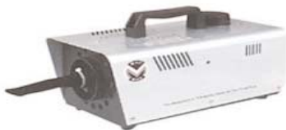
Snow 6: Sneeuwmachine 600 watt met remote