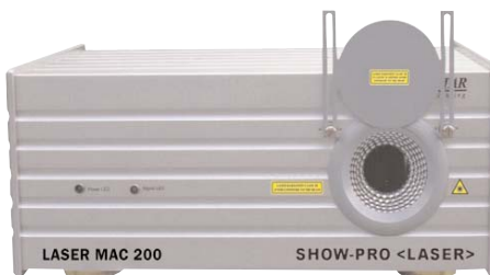
Mac-200: 200mW groene laser met software en flightcase. 10 DMX kanalen

200mW groene laser (532nm) in een rigide aluminium behuizing. Beschikt over 10 DMX kanalen maar kan ook in automatische modus werken of via meegeleverde software en USB-controller. Enkele functies: Blackout blanking, 64 gobo's,... Gobo effecten: rotatie, reactie, traag tekenen van logo's,... Verbruik: 75W Geleverd met USB-interface, software en robuuste flightcase.