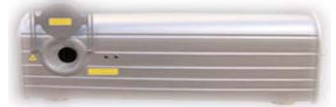
Mac-2007: Professionele RGVBL laser met software en flightcase, 13 DMX kanalen R150mW/G60mW/B60mW

13 DMX kanalen, 5 werkmodi: automatisch, op DMX512, master/slave; met IDLA connector of computergestuurd d.m.v. de bijgeleverde software en USB-interface; eveneens compatibel met "Pangolin LD2000". Verbruik: 120W Dimensies (mm): 620x300x230 Gewicht: 22,6kg. Met USB interface, software, flightcase