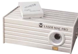
Mac-2005: Professionele RGY laser met software en flightcase, 10 dmx kanalen 2 Diodes: 300mW groen en 450 mW rood, geel door filtering.

10 DMX kanalen, 5 werkmodi: automatisch, op DMX512, master/slave, met IDA connector of computergestuurd d.m.v. de bijgeleverde "Laser Show" software en USB-interface; eveneens compatibel met "Pangolin LD2000". Meerdere lasers kunnen op 1 computer worden aangesloten. Verbruik: 80W. Dimensies (mm): 440x300x195. Gewicht: 19kg, geleverd met USB interface, software en flightcase.