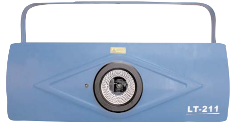
LT mac-211: RGB laser met software R80mW/ G30mW/B20mW, 7 kleuren, 24 DMX kanalen

7 kleuren: rood, geel, groen, cyaan, blauw, violet en wit. 24 DMX kanalen, 4 werkmodi: op muziek, automatisch, op DMX of computergestuurd d.m.v. de bijgeleverde "i TOP laser" software en USB-interface; eveneens compatibel met "Pangolin LD2000". Tekent zeer scherpe, dynamische afbeeldingen in schitterende kleuren. Dimensies (mm): 550 x 360 x 240. Gewicht: 20,3 kg