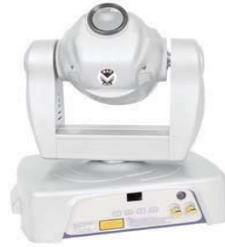
Mac-Head: 100mW groene moving head laser. Pan 360° Tilt 265°, 8 DMX-kanalen

Moving head laser 100mW groen 8 kanalen DMX, Pan 360° Tilt 265°, stand-alone, DMX mode, auto music en master/slave. Dimensions (mm): 375/Hx370/Lx275/P. Weight: 9.5 kg