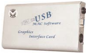
Mac Software 2: Software + USB interface voor laser LTMac 6

Programmeer effecten, teksten, logo's, tekeningen, cartoons, animaties, ... Door middel van blanking mode is er geen verbindinglijn nodig tussen twee van elkaar gezecheiden punten. Geleverd met kabel van laser naar interface (10m), en kabel van interface naar computer (1.5m). Programma op CD-ROM met handleiding.